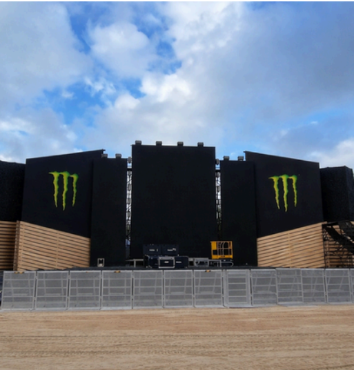
FESTIVALES Y CONCIERTOS

Los escenarios profesionales tienen necesidades específicas :